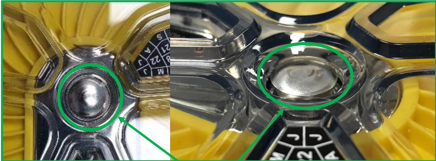
Figure 2 – Extrémité d'arbre évasée