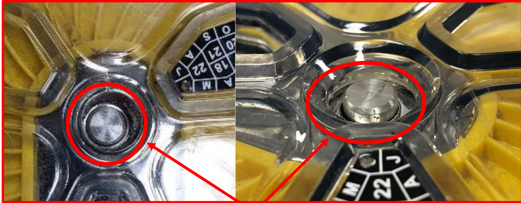
Figure 3 – Extrémité d'arbre non évasée